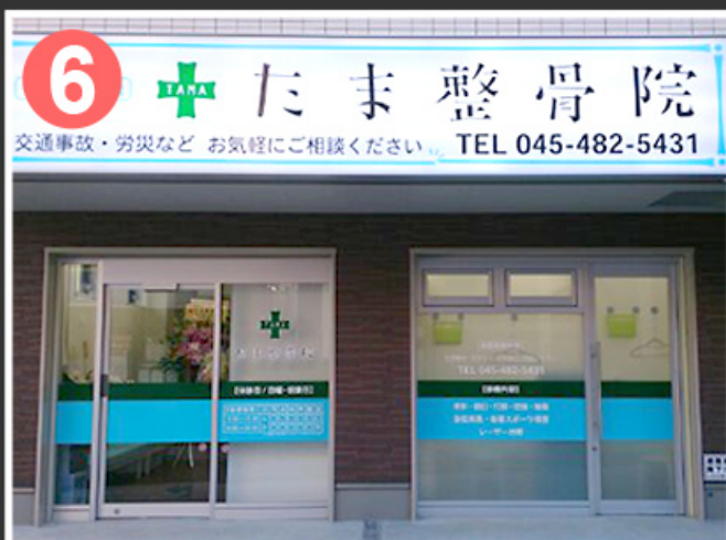
6 スーパー文化堂の斜め向かいにたま整骨院 横浜院 があります。