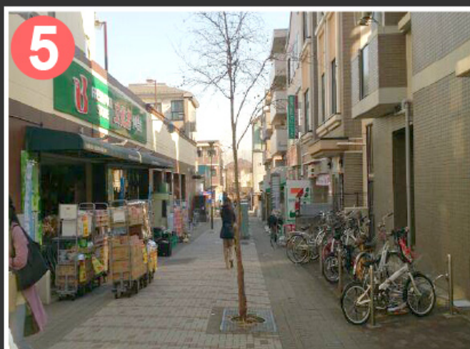
5 十字路を曲がるとスーパー文化堂が左手、セブンイレブンが右手に見えますのでそのまま直進。