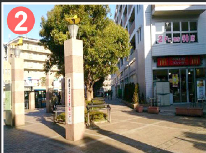
2 バスロータリーが左手、マクドナルドが右手の間の道に向かい、少し歩きます。