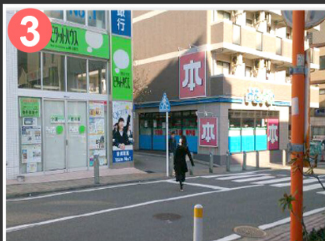
3 少し歩くと、横浜銀行とよむよむ（本屋）に挟まれた道が見えてきますのでその道に向かいます。